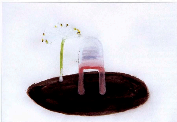
Mijn moeder in de Floriade