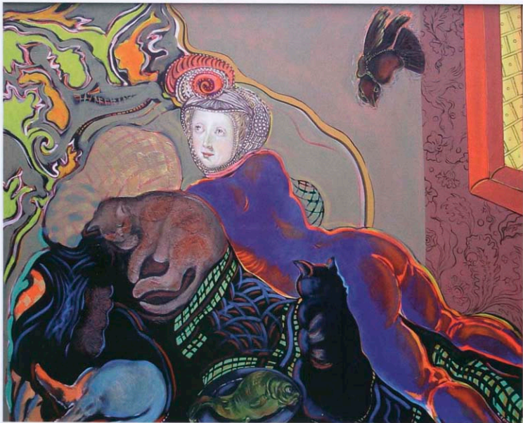
Hulpeloze odalisk 100 x 120 cm.

dezelfde steek als het borduursel van haar japon. Een meisje van adel moet immers alles kunnen doorstaan. Ze moet mishandelingen kunnen verdragen, maar onder alle omstandigheden haar sereniteit bewaren. Maar intussen wordt ze omringd door alle mogelijke symbolen die erop wijzen dat achter haar in de plooi gehouden gezicht een turbulent gevoelsleven schuil gaat.