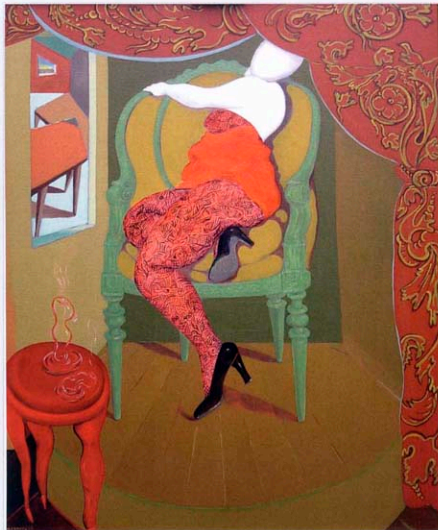
Raammeisje 120 x 100 cm.

meisje' is door het venster de zee te zien, met ervoor modernistische tafeltjes waarop van alles kan worden uitgesteld en opgediend.