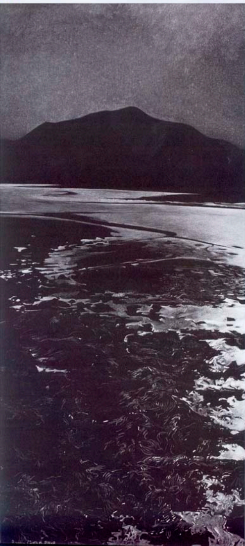
'Seaweed, Stones and Mud Fl. acryl op karton, 45 x 22 cm, 2008

en heb toen het uitzicht vertaald naar het licht zoals het daar 's nachts is. Want als 's nacht de maan schijnt kan het ongelooflijk helder zijn. De lichtintensiteit is enorm, zodat je dan veel kleuren kunt waarnemen en een enkele keer zelfs een regenboog bij maanlicht kunt zien. Dat is echt van een verbijsterende schoonheid.'