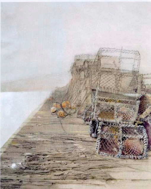
'Lobsterpots', acryl en potlood op karton, 39 x 32 cm, 2005