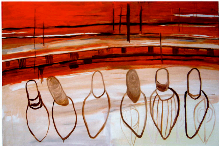
Oosterschelde schelpen, 80 x 120 cm, 2008, olieverf op doek