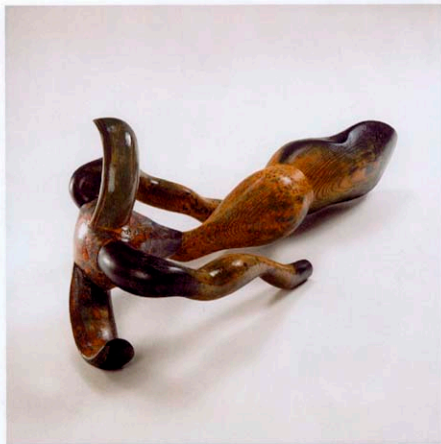
boven Maritiem Schepsel, 34 x 77 x 34 cm, 150 jaar oud grenen met grenen pennen, constructielijm, giethars, olieverf, polymeer, pigmenten, bootlak