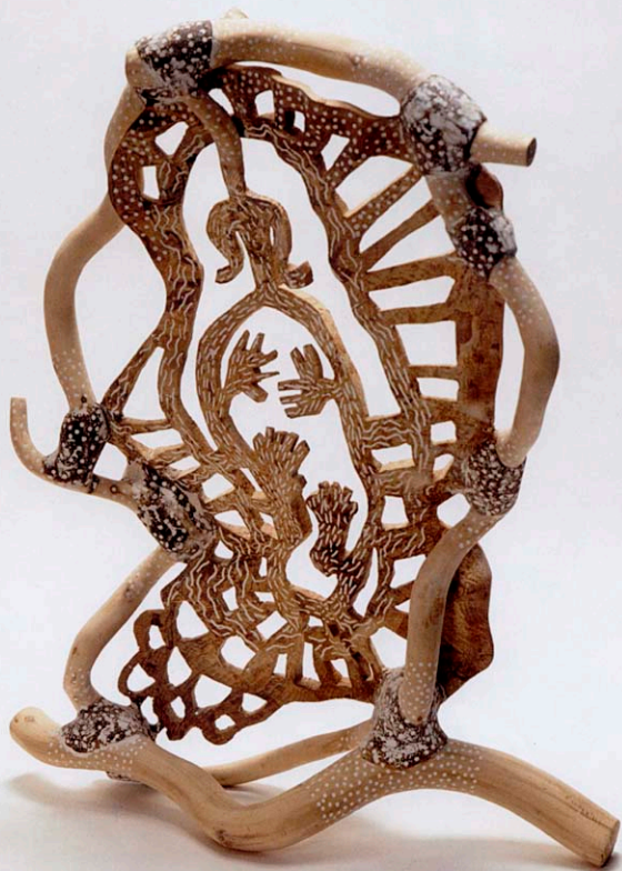
De Hoedster van de Aarde 3, beukenhout, kronkelwlg, pigment, kalk, polymeer